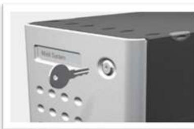
Solides Metallschloss mit 2 Schlüsseln