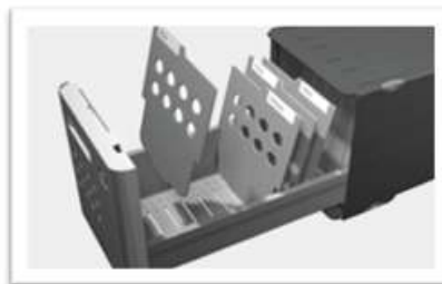
4 variabel einsetzbare Trennregister