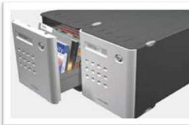
komfortabel durch Tipp-Mechanik