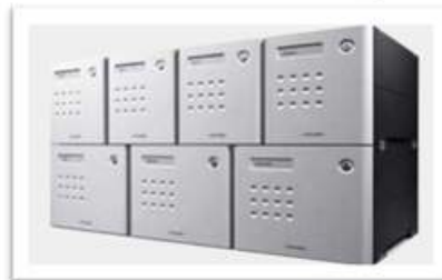
Vertikal und horizontal erweiterbar